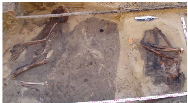
Abb. 5. Wusterhausen, spätlawisches Gräberfeld. Hockerbestattung Bef. 210 und partielle, verkohlte Bestattung Bef. 212.

Einige Gräber können als Sonderbestattungen bezeichnet werden. Dazu zählen nicht mehr im Verband liegende Skelette von Kleinkindern in runden bis quadratischen Gruben, die in vier Fällen in den Fußbereichen von Erwachsenengräbern lokalisiert waren. An einer Stelle wurden zwei Erwachsene in zueinander entgegengesetzter Orientierung direkt übereinander bestattet, allerdings nicht in derselben Grabgrube. Ob diese Toten in einer bestimmten Beziehung zueinander standen oder ob die Befundsituation eher zufällig entstand, muss offen bleiben. Zwei Bestattungen zeigen Spuren von Verbrennungen im Bereich der linken Brust. Man kann dies als Indizien für Teilverbrennungen der Leichen oder bestimmte Feuerrituale in der Grabgrube auffassen.