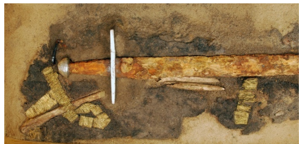
Abb. 7. Wusterhausen, spätslawisches Gräberfeld. Schwertgrab Bef. 55, restaurierter Schwertbefund mit Goldgewebe.

Die beiden Schwerter sind durch ihre halbkugel- bis paranussförmigen Knäufe charakterisiert. Der Griff des Schwertes aus Grab 112 (Abb. 8) ist mit Leder umwickelt. Parierstange und Knauf sind bei dem Exemplar aus Grab 55, das sich auch durch das Goldgewebe auszeichnete, flächig silberplattiert (Abb. 7). Es ist somit eine ausgesprochene Prachtwaffe. Konstruktiv und in den Abmessungen sind sich die Schwerter recht ähnlich. Sie entsprechen beide dem Spatha-Typ, sind jeweils etwa 1 m lang und haben gerade Parierstangen von etwa 16 cm Länge. Nach einer ersten typologischen Bewertung können sie als jüngere Variante des Typs X nach J. Petersen (1919) oder einer der darauf basierenden Varianten im Übergang zu den romanischen Schwertern betrachtet werden. Der Typ X ist eine der häufigsten Schwertarten im ganzen Ostseeraum der jüngeren Wikinger- und Slawenzeit und dominiert – neben der Variante \alpha nach A. Nadolski (1954, 26 f.) – auch unter den slawischen Grabfunden an der südlichen Ostseeküste (vgl. Wrzesiński 1997/98, 31). Während J. Petersen (1919, 160 ff.) den Typ X v. a. in das 10. und seltener noch 11. Jh. verwies, haben u. a. R. Oakeshott (2000, 23 ff.; 2002), A. Nadolski (1954, 256), A. T. Ruttkay (1976, 250 f.), V. Kazakevičius (1996, 67 ff.) und V. Schmidt (1992, 48) darauf hingewiesen, dass dieser Waffentypus noch bis in das 12. oder sogar frühere 13. Jh. lief. Die Wusterhausener Schwerter sind am ehesten in die Zeitspanne vom späten 11. bis 12. Jh. einzuordnen.