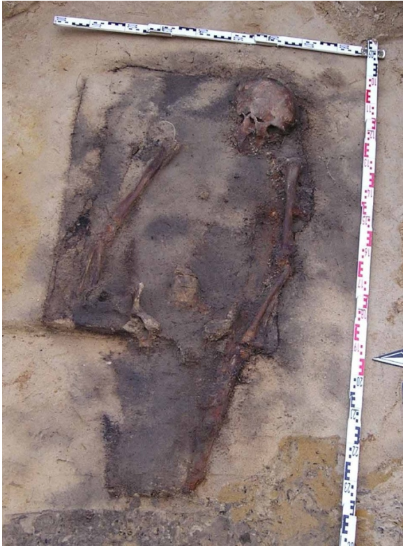
Abb. 6. Wusterhausen, spätslawisches Gräberfeld. Schwertgrab Bef. 112 im Planum.