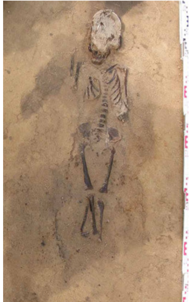
Abb. 3. Wusterhausen, spätlawisches Gräberfeld. Kinderbestattung Bef. 152.

Abweichung von der eigentlich angestrebten West-Ost-Ausrichtung (vgl. Biermann 2003, 617 Anm. 6, 7) und mag somit bereits christliche Einflüsse anzeigen. Grabtiefen von ca. 1 m waren die Regel, doch gab es auch einige bis zu 2 m tiefe Gruben.