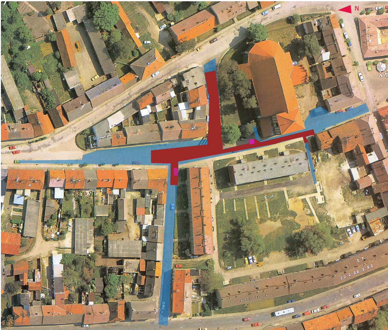
Abb. 1. Wusterhausen. Luftbild des Areals um die Kirche St. Peter und Paul mit den prospektierten Bauflächen (blau), der Ausdehnung des Gräberfeldes (rot) und der Lage der beiden Schwertgräber (lila) (Luftbild Stadt Wusterhausen, Bearbeitung: TOPO-Archäologie).

Talsandinsel in der Dosseniederung. Die 1291 „civitas“ genannte Stadt, deren Name auf slawisch +ostrogъ, „mit Palisaden befestigter Platz“, zurückgehen soll (Herrmann 1960, 69), wurde wohl schon in der ersten Hälfte des 13. Jhs. privilegiert (Enders 1970, 299 f.; Plate 1979, 265; Heinrich 1995, 398 f.). Sie entstand im Anschluss an einen großen spätslawischen Burgwall, der einen Übergang über die Dosseniederung sicherte und zugleich ein wichtiges Herrschaftszentrum im südlichen Stammesgebiet der Dossanen war. Die Bedeutung des Wusterhausener Kleinraums schon in slawischer Zeit wird nicht nur durch diese Wehranlage, sondern auch durch eine weitere, unfern gelegene Befestigung – wahrscheinlich ein kleinerer, mittelslawischer Ringwall – und mehrere Siedlungsplätze in der Umgebung belegt. 3