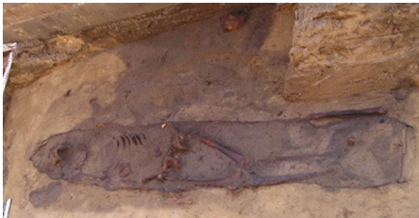
Abb. 4. Wusterhausen, spätlawisches Gräberfeld. Bestattung mit Baumsarg im zweiten Planum (Foto: O. Brauer).

genstände lassen sich als Gürtelteile deuten, dazu kommen in vier Gräbern Messer. In zwei Bestattungen deuten Schatten auf vergangene Holzgefäße hin, in zwei weiteren gab es Münzen. Eine der Münzen war als Obolus einem Toten in den Mund gelegt worden, die zweite fand sich in der Grabgrube eines Erwachsenen in einem Baumsarg (Grab 118). Bei letzterer handelt es sich um einen „verballhornten Kölner Pfennig“ der Gruppe „Bard?B1“ nach Chr. Kilger (2000, 190 f.), wohl eine Prägung aus Bardowiek unter Heinrich IV. Sie datiert in die Jahre 1060-1080. Die Münzen könnten zur Bezahlung der Überfahrt ins Totenreich im Sinne eines „Charonspfennigs“ gedient haben, wobei sich dieser Brauch aus der Antike über Byzanz, die Awaren und Großmähren oder über den Ostseeraum an die nördlichen Westslawen vermittelt haben dürfte (Gräslund 1965/66; Steuer 1970, 148 f.; Biermann 2003, 622). Man hat auch vermutet, dass die Münzen bildlich einen dem Toten zustehenden Teil des Stammeseigentums ausdrücken sollten, als „Wiedergutmachung von Seiten der Überlebenden für den Nachlass des Toten“ (Gräslund 1965/1966, 192). Ferner sollten die Geldstücke möglicherweise die Nahrungsbeigabe ersetzen, besonders unter Einfluss des Christentums: Bei den Nordwestslawen der spätlawischen Zeit „scheint der Obolus geradezu als Beigabenersatz gedient zu haben“ (Steuer 1970, 148 f.).