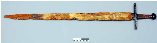
Abb. 8. Wusterhausen, spätlawisches Gräberfeld. Schwert aus Bef. 112.

Eimer sind recht häufige Funde in Gräbern des 9. bis 12. Jhs. im slawischen Raum und z. B. aus Tschechien, Nordostbayern, Thüringen, Großpolen, Schlesien und Masowien bekannt. Sie gehören hier teilweise zu ausgesprochenen Prachtgräbern. Das Exemplar aus Wusterhausen dürfte an die pommersche Verbreitung entsprechender Funde anknüpfen, die dort aus dem „fürstlichen“ Grab des späteren 12. Jhs. von Denzin (Dębczyno; Kóčka-Krenz/Sikorski 1998, 533 f.), dem reich ausgestatteten Grab von Barwin (Barwino; Eggers 1978, 185 f.; 1985, Taf. 95), eventuell aus dem Schwertgrab von Techlipp (Ciecholub; Sarnowska 1955, 277) und einfacheren Bestattungen von Wolin (Wolin), „Mühlenberg“, und Streckentin (Strykocin; Malinowska-Lazarczyk 1982, 116.) belegt sind.